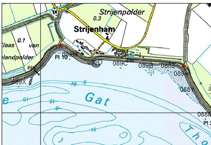
Figuur 1: ligging haventje Strijen Ham

Momenteel is het dijktraject ten noorden van het Tholense Gat in ontwerp. Het haventje nabij Strijen Ham (zie figuur 1) heeft cultuurhistorische waarde en dient bij de versterking van de achterliggende primaire kering zo min mogelijk aangetast te worden. Volledig of deels verwijderen van het havendammetje ten behoeve van het aanbrengen van nieuwe bekleding op de achterliggende dijk is dan ook niet gewenst. Hiertoe heeft Projectbureau Zeeweringen een alternatief bedacht waarbij de achterliggende kering op sterkte wordt gebracht door plaatsing van een damwand in het bestaande dijklichaam.