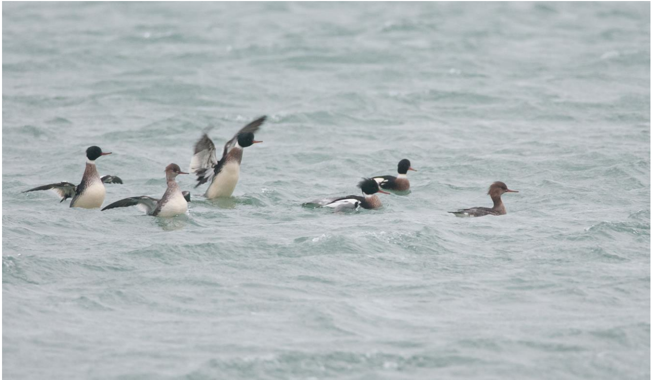
Middelste zaagbekken

De aantallen slapende brilduikers op het Markiezaat zijn relatief laag. Slechts tijdens één telling zijn vogels vastgesteld. In de kom van de Oosterschelde worden grote aantallen brilduikers geteld, deze slapen deels in het Zoommeer en mogelijk deels in de Oosterschelde zelf.