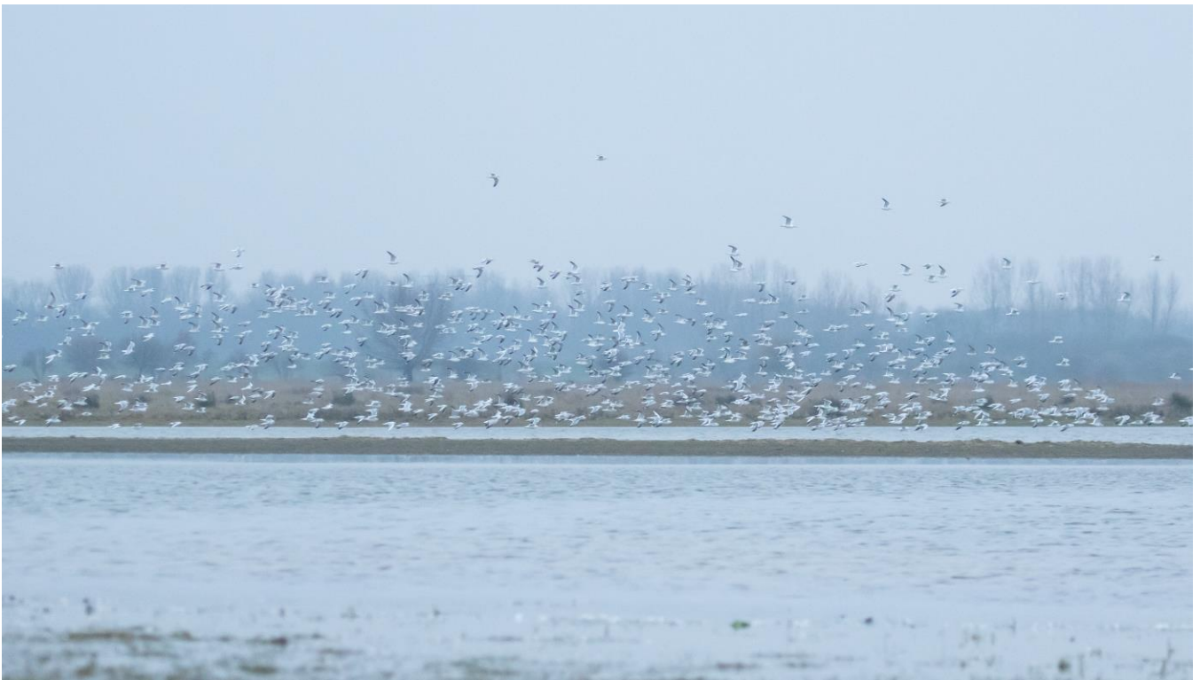
Invliegende stormmeeuwen en kokmeeuwen op de slaappleats in het Markiezaat, 15 december 2021

De meeste meeuwen arriveren ruim voor zonsondergang en bij aankomst waren dan ook bij iedere telling al flinke aantallen op de slaappleats aanwezig. De meeste meeuwen slapen staand in ondiep water op drijven in het ondiepe water tegen de oever. Opvallend was dat, tijdens de novembertelling, de aanwezige meeuwen op de slaappleats zich weinig aan leken te trekken van de aanwezigheid van een foeragerende vos vlakbij de slaappleats. De meeste zilvermeeuwen sliepen in de ondiepe zone rondom het eiland de Spuitkop.