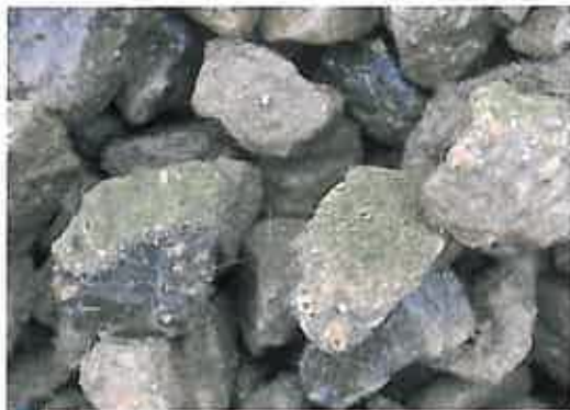
Figuur 2 Elastocoast dijkbekleding met aangroei van Klein Darmwier.