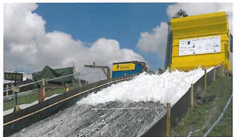
Figuur 5 Een overslagproef is uitgevoerd met Elastocoast, waarbij het materiaal overslagvolumes van 125 \text{ l s}^{-1} \text{ m}^{-1} doorstond, met stroomsnelheden van 6\text{-}12 \text{ m s}^{-1} .