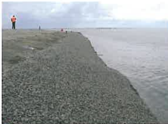
Figuur 3 De testlocatie bij Ouwerkerk bij rustig weer (l) en stormachtige omstandigheden (r).