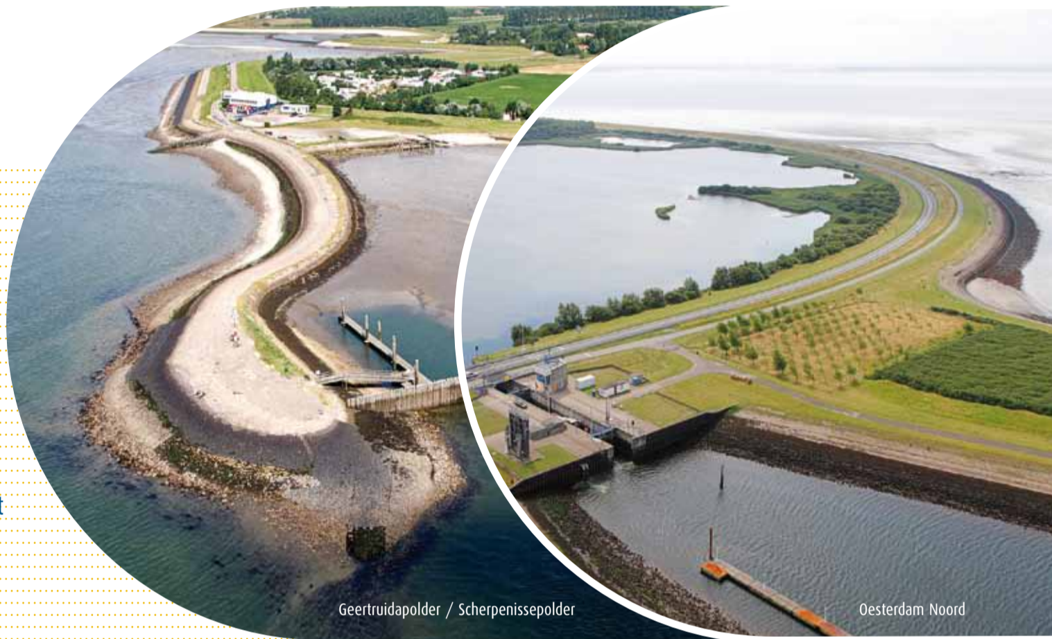
Geertruidapolder / Scherpenissepolder

Zeeuwen hoeven zich geen zorgen te maken over natte voeten. De dijken beschermen Zeeland tegen overstromingen. Projectbureau Zeeweringen zorgt ervoor dat dit in de toekomst zo blijft. Dit jaar versterken we twee dijktrajecten bij u in de buurt. In deze krant leest u over het werk.