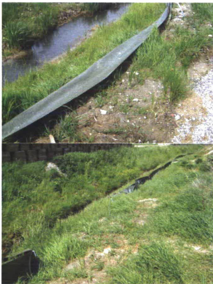
Afbeelding 3: Foto's van het paddenscherm.

Tijdens het veldbezoek stond het paddenscherm alleen langs het gebruikte deel van het depot (zie afbeelding 4). Hiermee wordt niet voorkomen dat padden mogelijk de dijk optrekken bij werkzaamheden, omdat het deel van het depot dat het meest aantrekkelijk is voor rugstreepadden niet is afgeschermd. Hoewel het scherm goed aangebracht lijkt te zijn, is in een deel het zand verdwenen, is een deel losgeraakt en is een ander deel beschadigd (zie foto's). Het paddenscherm voorkomt niet dat padden tijdens werkzaamheden naar de dijk kunnen trekken. Het advies luidt om het scherm te repareren en door te trekken langs de hele westgrens van het depot.