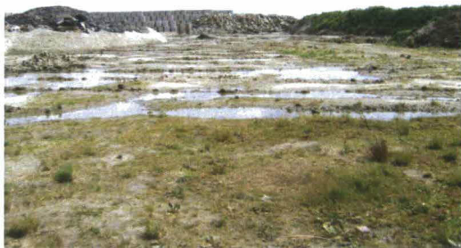
Afbeelding 1: deel van het depot geschikt voor Rugstreepad.

Vorig jaar zijn maatregelen genomen om waterplassen op te heffen. Met name rond het depot dat in gebruik is, zijn de waterplassen verdwenen. Ook in het zuidelijke deel van het depot zijn de grote waterplassen verdwenen. Alleen in de diepere delen, die zijn ontstaan door het rijden met zwaar materieel is water aanwezig.