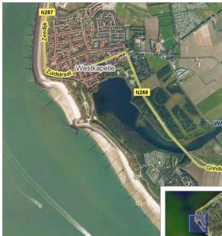
Figuur 4: Luchtfoto Gat van Westkapelle dp 0211 – dp 0225