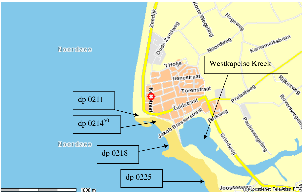
Figuur 3: Gat van Westkapelle dp 0211 – 0225