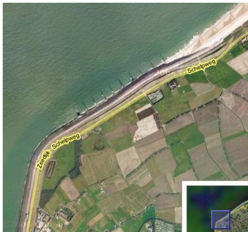
Figuur 2: Luchtfoto aansluitende deel Domburg dp 0169 – dp 0185