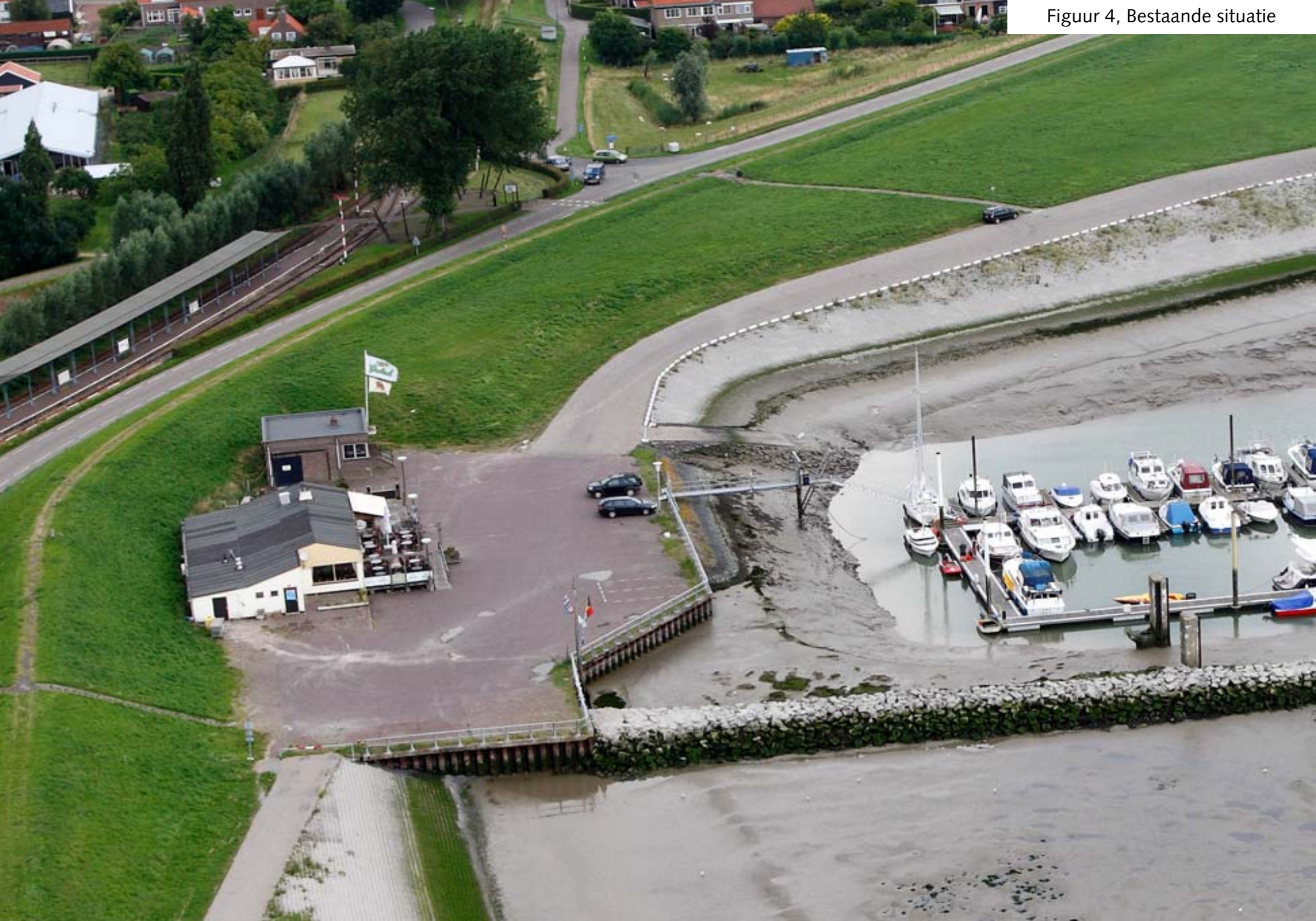
Figuur 4, Bestaande situatie