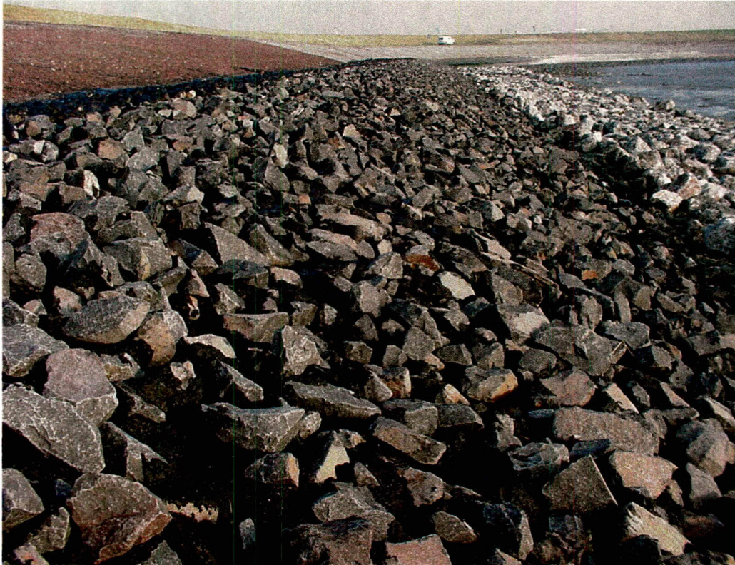
Proefvak gepenetreerde breuksteen Borssele-Staartsche Nol