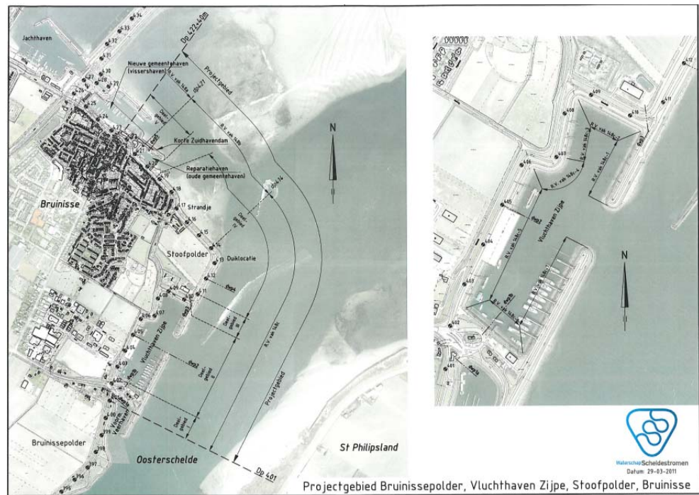
Tabel 1 geeft de ligging van de verschillende deelgebieden langs het dijktraject.

Ligging van het projectgebied. In bijlage 1 is een grotere versie van deze afbeelding weergegeven.