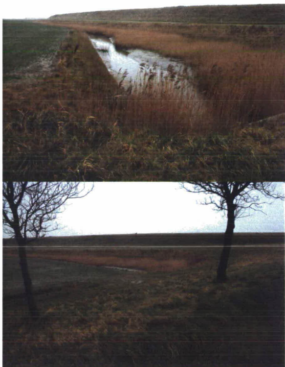
Afb. 3.1 Sloot en rietkraag