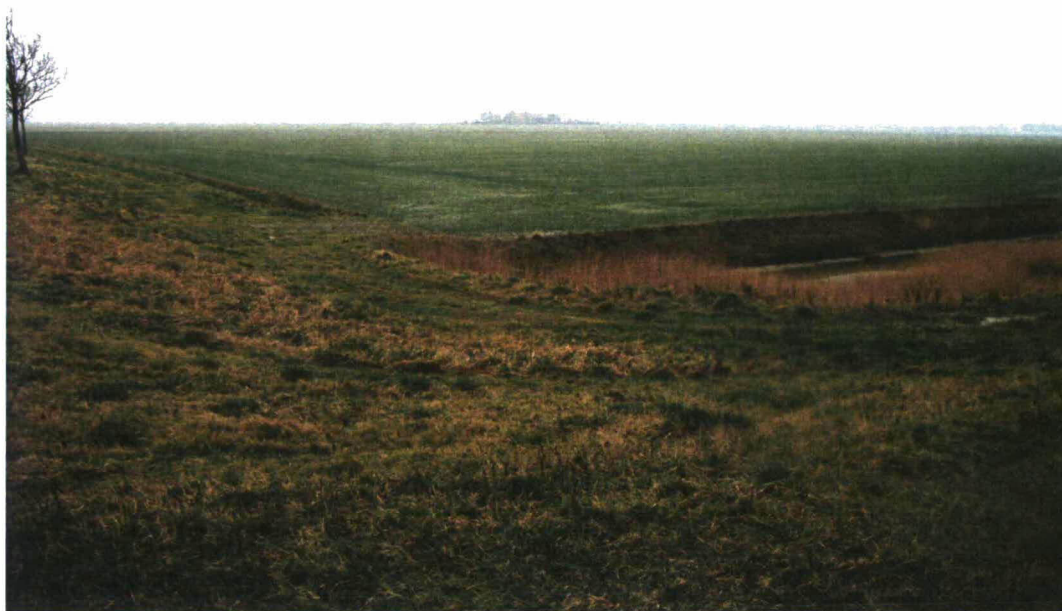
Afb. 2 Overzicht locatie