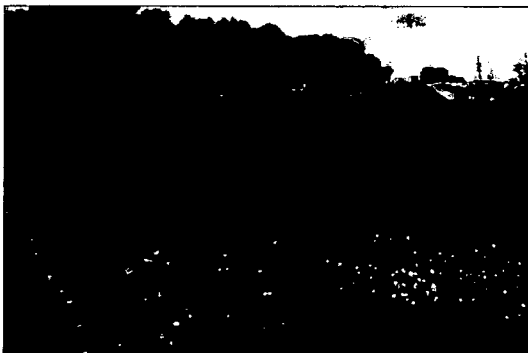
Impressie dijktraject en voorland

Voorland: het dijktraject grenst aan haventerrein, niet aan de Westerschelde. Het voorterrein was en is nog steeds rommelig.