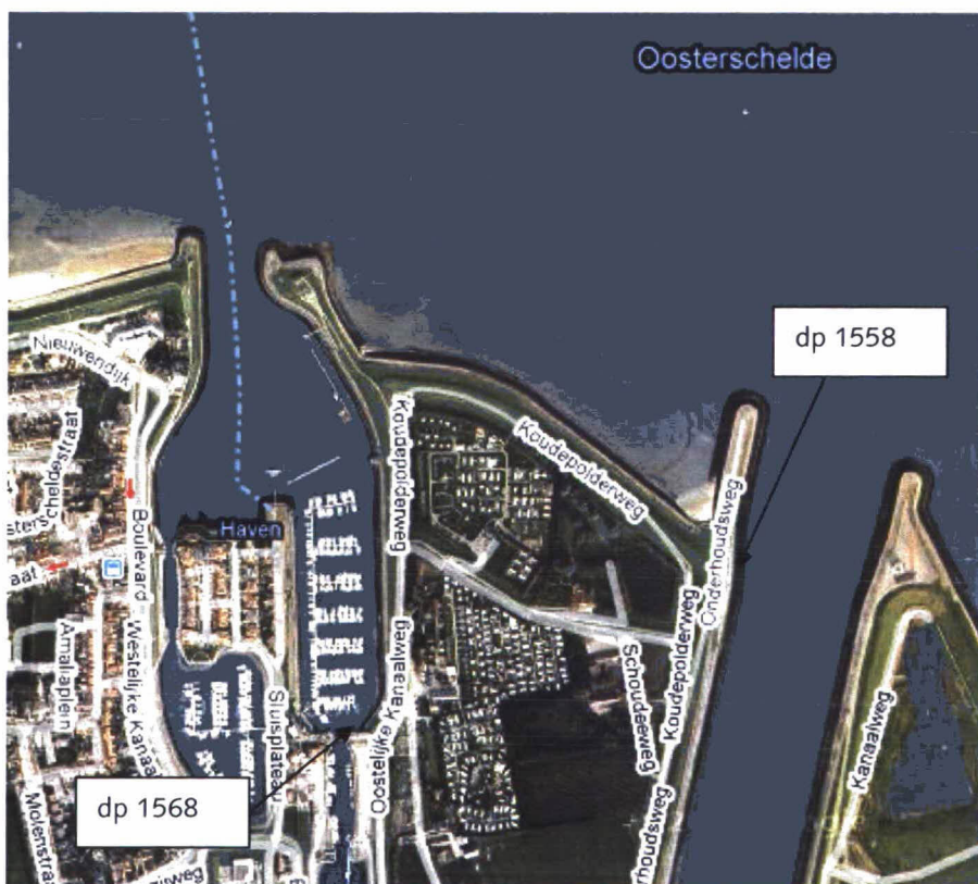
Figuur 1: Luchtfoto Snoodijkpolder

Een luchtfoto van het traject is weergegeven in figuur 1.