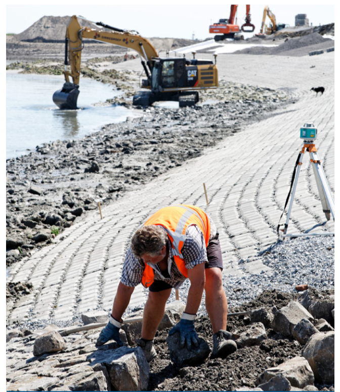
De steenzetter aan het werk met basalt

‘In het stormseizoen mag er niet aan de dijken gewerkt worden. Dan werk ik in de havens van Rotterdam of elders in het land. Toch sta ik het liefst op een Zeeuwse dijk met de