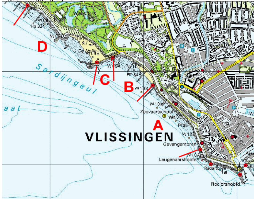
Figuur 1 Ligging dijkvakken