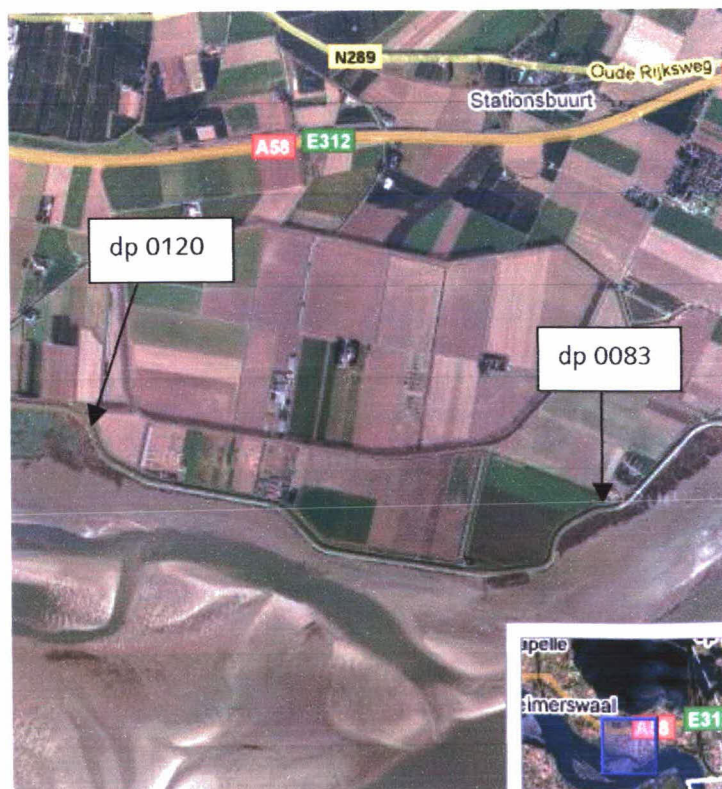
Figuur 1: Luchtfoto Zimmermanpolder dp 0083 – dp 0120

Een luchtfoto van het traject is weergegeven in figuur 1.