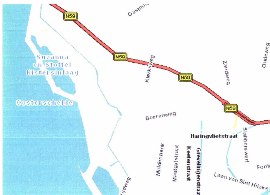
Figuur 1: Kaart Polder Schouwen dp 0160 – dp 0162

Dit rapport is een aanvulling van de toetsing van de dijk van Polder Schouwen, gelegen op Schouwen-Duiveland aan de Oosterschelde tussen dp 0120 en dp 0160. Deze aanvulling beschrijft het gedeelte tussen dp 0160 en dp 0162 (zie onderstaande figuur 1). De aanvulling is gemaakt op verzoek van het Projectbureau Zeeweringen om voor de uitvoer een logische "knip" te kunnen leggen bij dp 0162. In SteenToets is de gezette steenbekleding getoetst, voor de volledigheid is de niet-gezette steenbekleding administratief opgenomen. Deze bekleding kan niet in SteenToets worden getoetst.