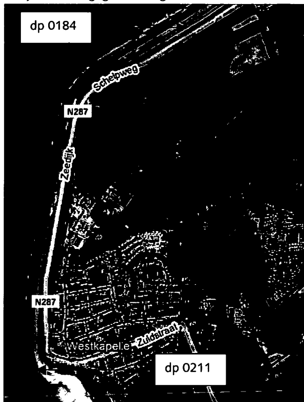
Figuur 1: Luchtfoto Westkapelse Zeedijk fase 1 dp 0184 – dp 0211

Een luchtfoto van het traject is weergegeven in figuur 1.