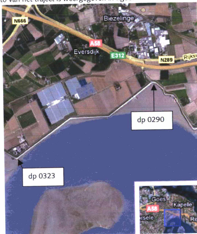
Figuur 1: Luchtfoto Willem-Annapolder dp 0290 – dp 0323

Een luchtfoto van het traject is weergegeven in figuur 1.