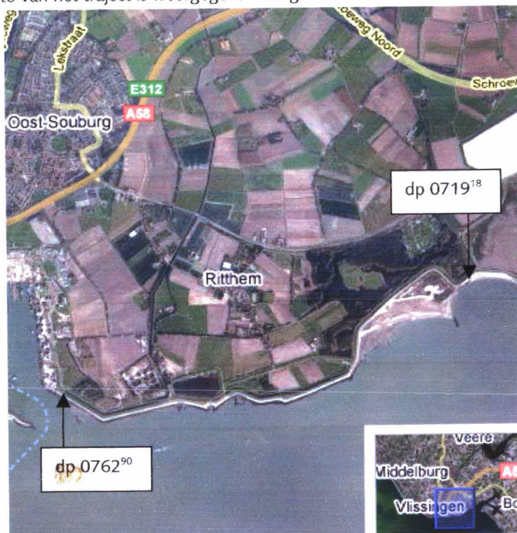
Figuur 1: Luchtfoto Zuidwatering dp 0719 18 – dp 0762 90

Een luchtfoto van het traject is weergegeven in figuur 1.