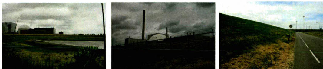
Figuur 1.2 Overzicht situatie rondom het dijktraject

Het binnendijkse gebied bestaat volledig uit de bebouwing en infrastructuur van de energiecentrale, in beheer bij EPZ. Tussen het bedrijfsterrein en de dijk ligt een openbare weg (Zeedijk).