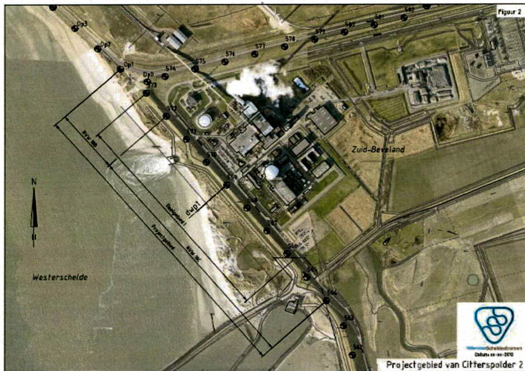
Figuur 1.1 De ligging van het dijktraject Van Citterspolder langs de Westerschelde.

Het dijktraject Van Citterspolder 2 ligt op Zuid-Beveland, aan de rand van het havengebied van Vlissingen-Oost en direct voor de energiecentrale van Borssele (zie Figuur 1.1 of bijlage 9) aan de Westerschelde. De dijk is geen onderdeel van een gesloten dijkkring, maar behoort wel tot de primaire kering.