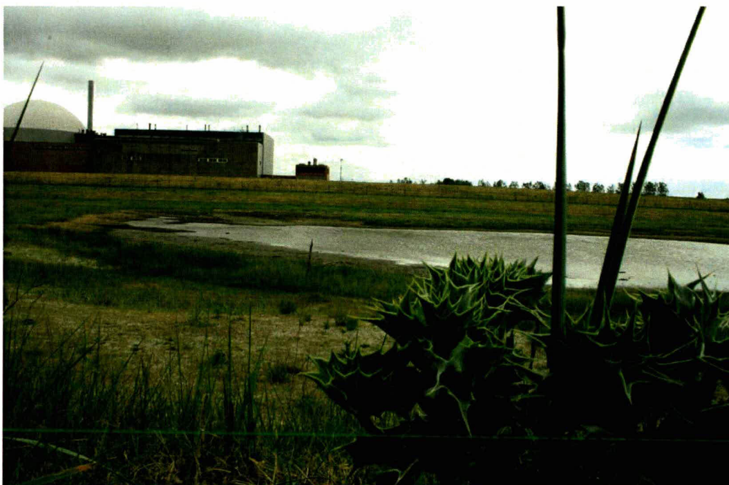
Fig. 4.1 Groeiplaats blauwe zeedistel

Op ruime afstand van het dijktraject ligt een grote groeiplaats van de beschermde blauwe zeedistel. Zeker 100 exemplaren groeien daar in een dynamisch stukje duin van de Kaloot (fig.4.1).