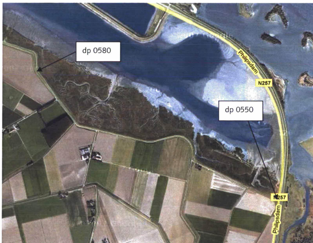
Figuur 1: Luchtfoto Anna Jacobapolder, Prins Hendrik Kramerpolder

Een luchtfoto van het traject is weergegeven in figuur 1.