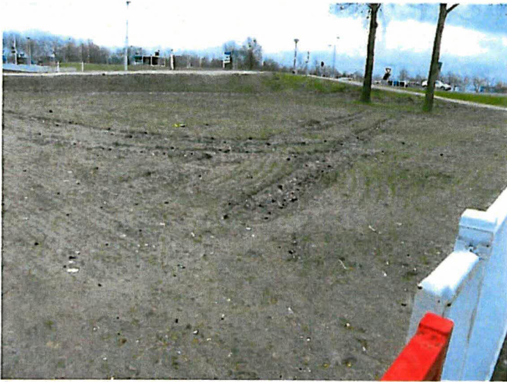
Sporen grondwerk middensluis