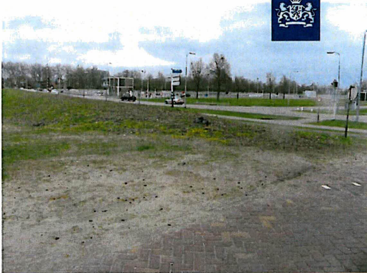
Steenresten in het grondwerk