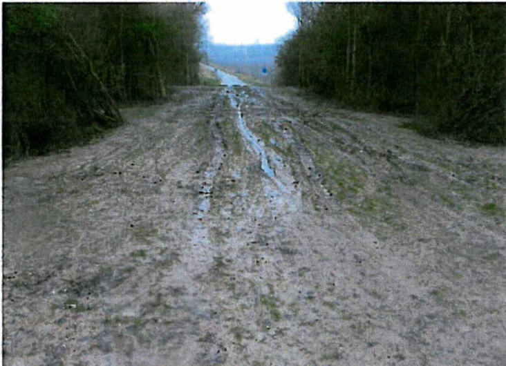
Sporen in grondwerk ter plaatse van tijdelijke dijkovergang.