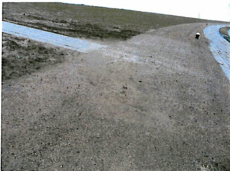
Situatie rondom pellicht