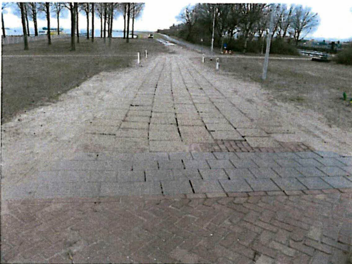
Kierende verharding van betonblokken