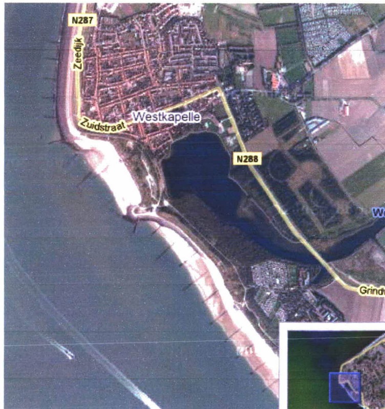
Figuur 4: Luchtfoto Gat van Westkapelle dp 0211 – dp 0225