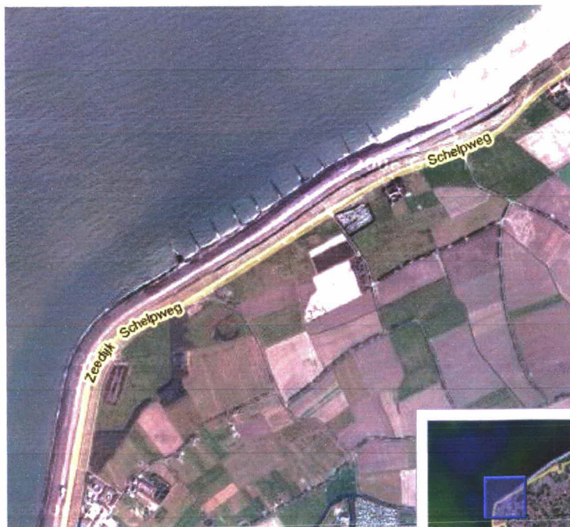
Figuur 2: Luchtfoto aansluitende deel Domburg dp 0169 – dp 0185