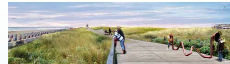
Impressie van de duinboardwalk