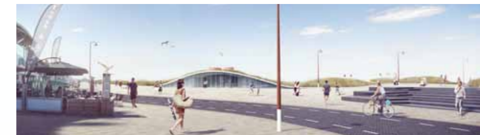
Impressie van de centrale strandafgang bij de Voorstraat