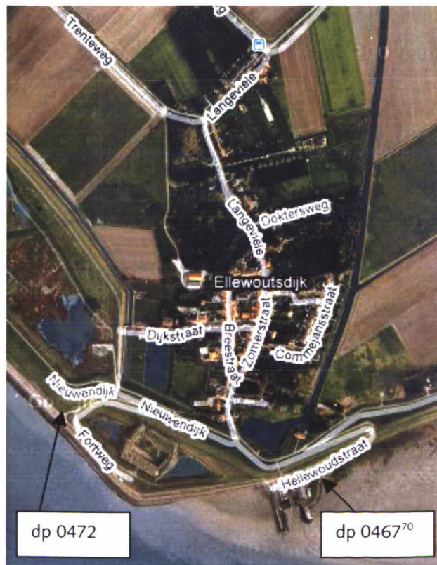
Figuur 1: Luchtfoto Ellewoutsdijk, Fort en Haven

Een luchtfoto van het traject is weergegeven in figuur 1.